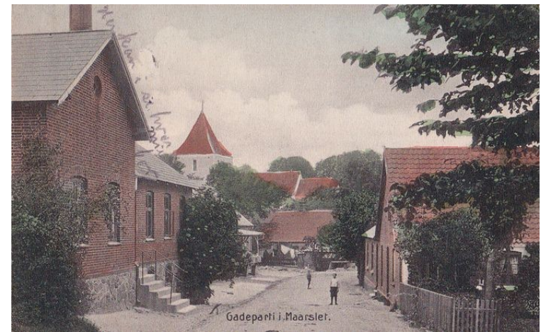
Postkort fra 1907.