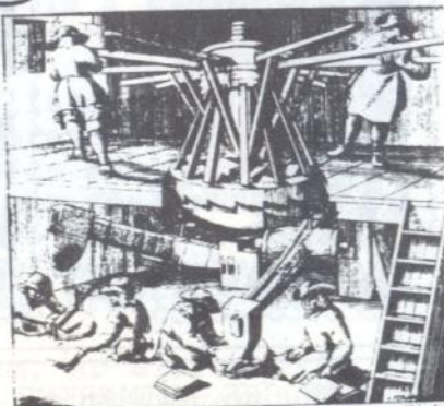
Plademøntprægning i Sverige år 1716

Her gengivede afbildninger viser hvor stort et møje og besvær det kunne være at lave mønter og sedler i 16-1700 tallet.