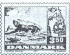
- Vindermærket - "Årets frimærke 1983"

Nr. 2 i konkurrencen blev 2,50 kr's marked - Egeskov Slot - ligeledes tegnet af Claus Achton Friis. Ialt blev der afgivet 43107 stemmer i konkurrencen om årets smukkeste frimærke.