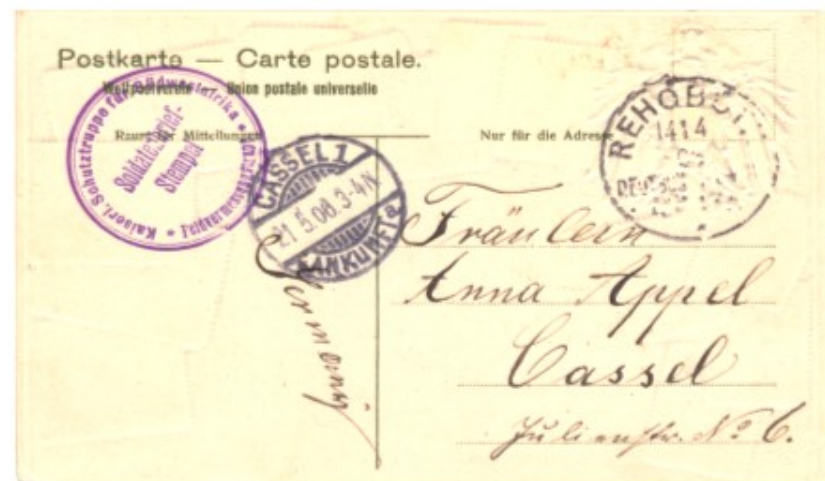
Bagsiden til det flotte tyske kort (afbilledet på forsiden).