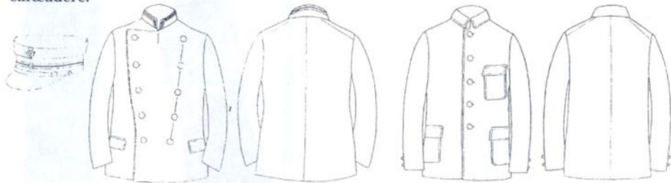
Uniformsjakke og hue