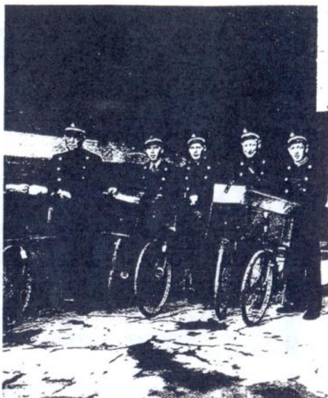
Landpostbude fra Nykøbing Falsters postkontor i 1944

Fra 1922 blev der leveret enradede sommerjakker af