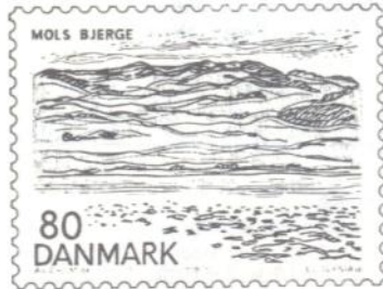
80 øre: Mols bjerge

I en serie frimærker med motiver fra Nordjylland udsender Post- og Telegrafvæsenet den 6. september 1979 fire særfrimærker i værdierne 80, 90, 200 og 280 øre.