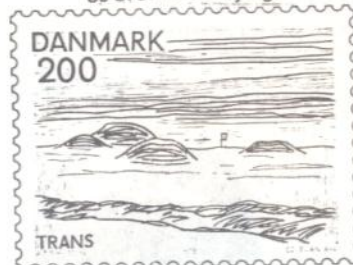
200 øre: Trans