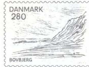
280 øre: Bovbjerg