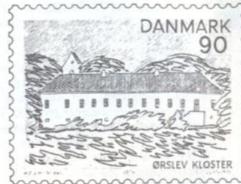
90 øre: Ørslev kloster

I anledning af 200-året for Adam Oehlenschlägers fødsel udsender Post- og Telegrafvæsenet den 4. oktober 1979 et særligt frimærke i værdien 1.30 kr. i rød farve med en silhuet af Adam Oehlenschläger som motiv.